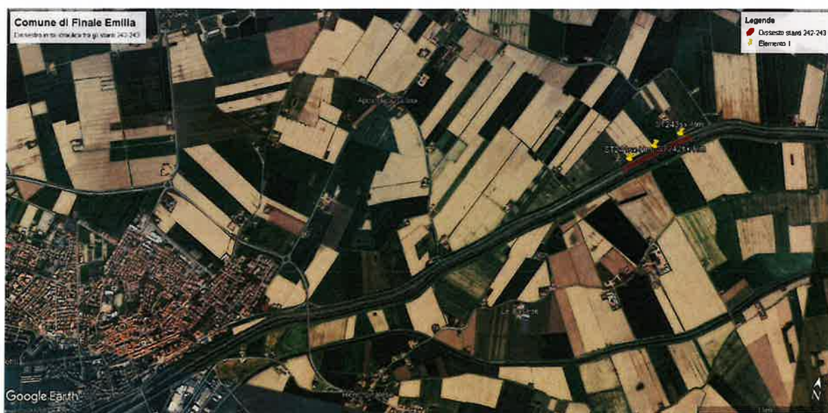
Figura 1 – localizzazione dell’intervento tra gli stanti 242-243 su ortofoto (Comune di Finale Emilia)

La lunghezza complessiva del tratto oggetto di intervento è pari a circa 600 m. L’intervento in progetto consiste essenzialmente nel consolidamento della struttura arginale che presenta, allo stato attuale, fenomeni di dissesto.