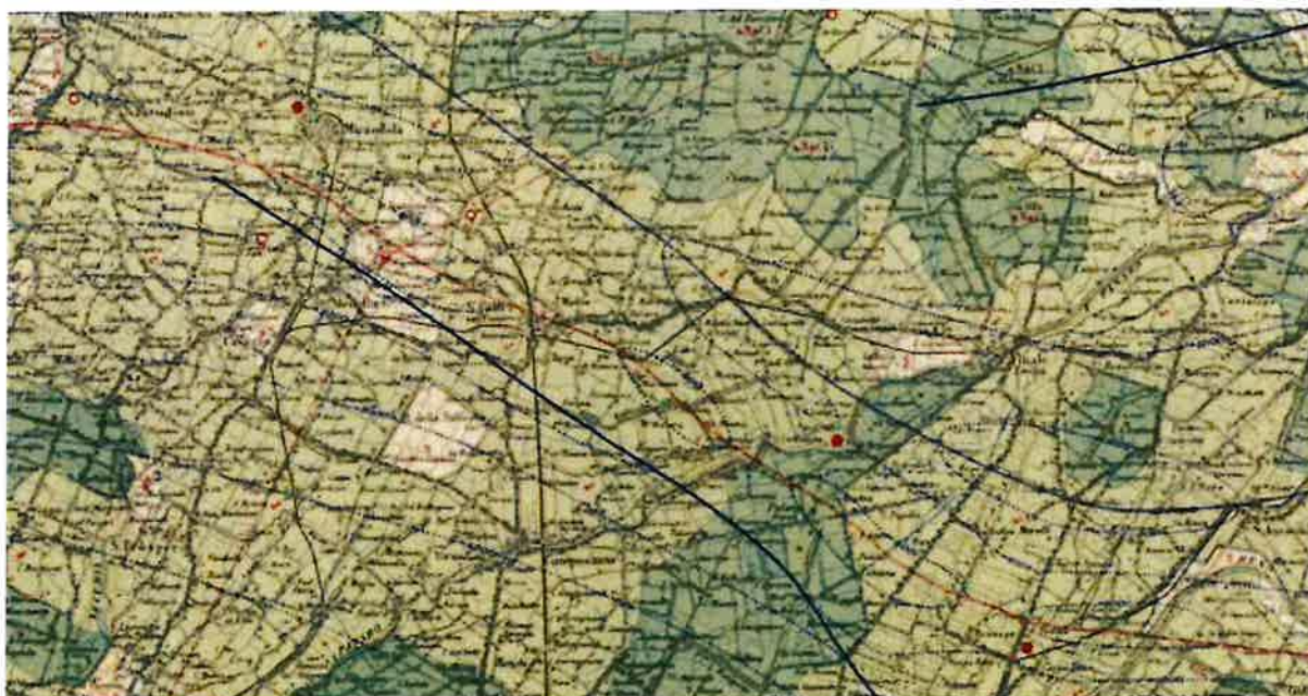
Litologia di superficie

Di seguito si riporta uno stralcio della carta sopra citata (Fig. 2.1)