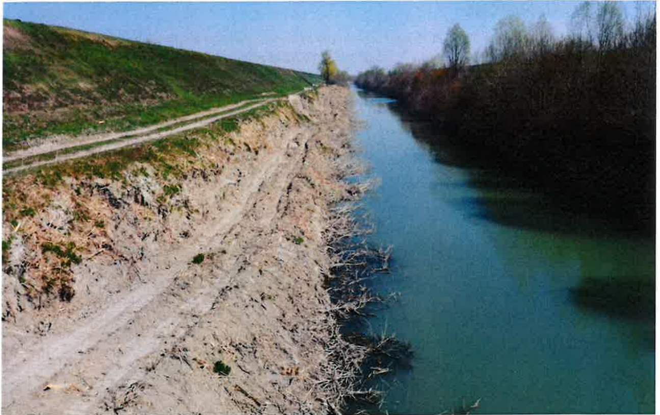
Figura 2 – foto dell'argine oggetto dell'intervento di adeguamento – tratto tra stanti 242-243 (Comune di Finale Emilia)